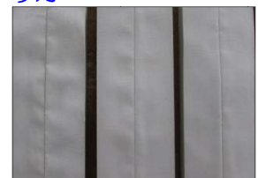
シングルステッチ